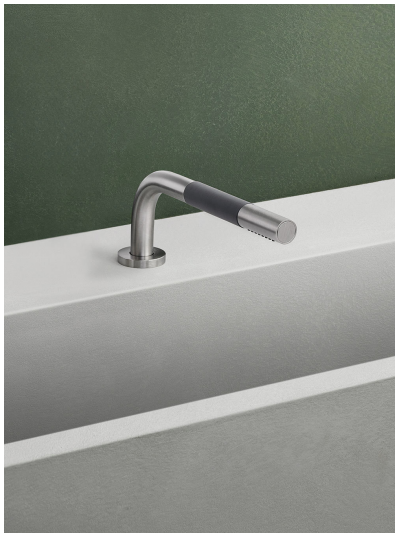
T1 Douche à main sur plan avec flexible de douche. Épaisseur du plan : max 45 mm. Percement du trou : 30 mm.