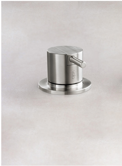
2500 Mitigeur sur plan (gros debit), levier de commande 25 mm.